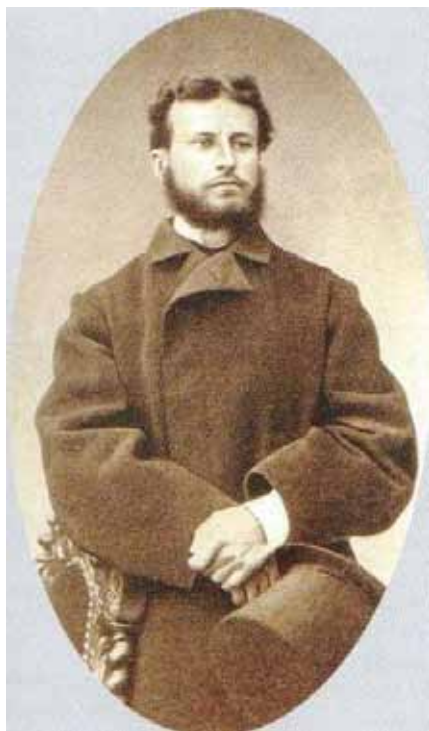
В.В. Верещагин во время первой поездки на Кавказ. Фотография. 1864 г.

Участок этот, ширина которого по берегу моря равнялась тремстам